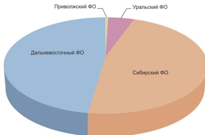
Рис. 19.2. Распределение численности колонка в России по федеральным округам в 2013 г.

Следует отметить, что из Республики Саха (Якутия) сведения по численности пушных зверей, в т.ч. и колонка, в достаточно полном объеме впервые поступили от республиканского Россельхознадзора в 2006 г. До этого они носили отрывочный, разрозненный характер. Оценка численности колонка за 2000-2006 гг. составляла от 16,5 до 26,6 тыс. особей соответственно. В материалах, поступивших в 2010 г. от специально уполномоченного органа в области охоты – Департамента охотхозяйства Республики Саха (Якутия), оценки численности колонка изменены и существенно отличаются от приведенных ранее. Так, численность в 2004 г. по разным источникам составляет 26,6 тыс. особей (Россельхознадзор) и 11,4 тыс. особей (Департамент), т.е. разница в оценках более чем в два раза. По данным, представленным Департаментом охотхозяйства Республике Саха за 2008 г. и 2009 г., численность колонка оценивается в 6,2 тыс. и 5,4 тыс. особей соответственно. Таким образом, некоторая несоразмерность оценок численности в таблице начиная с 2008 г. по Республике Саха объясняется разными источниками предоставления официальной информации. По учетным данным 2013 г., численность колонка стабилизировалась с тенденцией небольшого роста и составляет 8,7 тыс. особей.